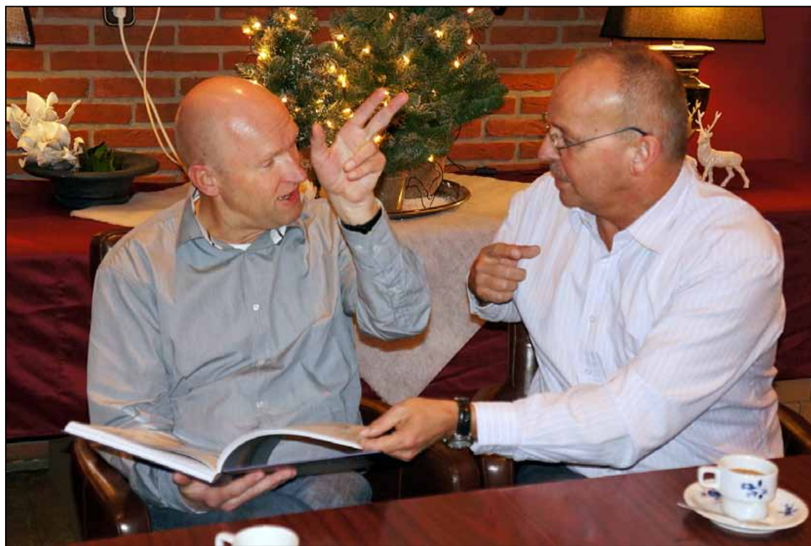
Meteen na de presentatie van het boek begon de discussie over wie nou waar had gewoond en wat hij had gedaan.