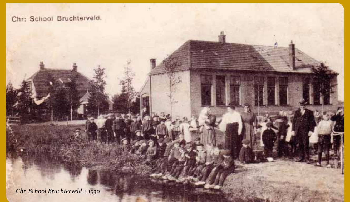
Chr. School Bruchterveld ± 1930