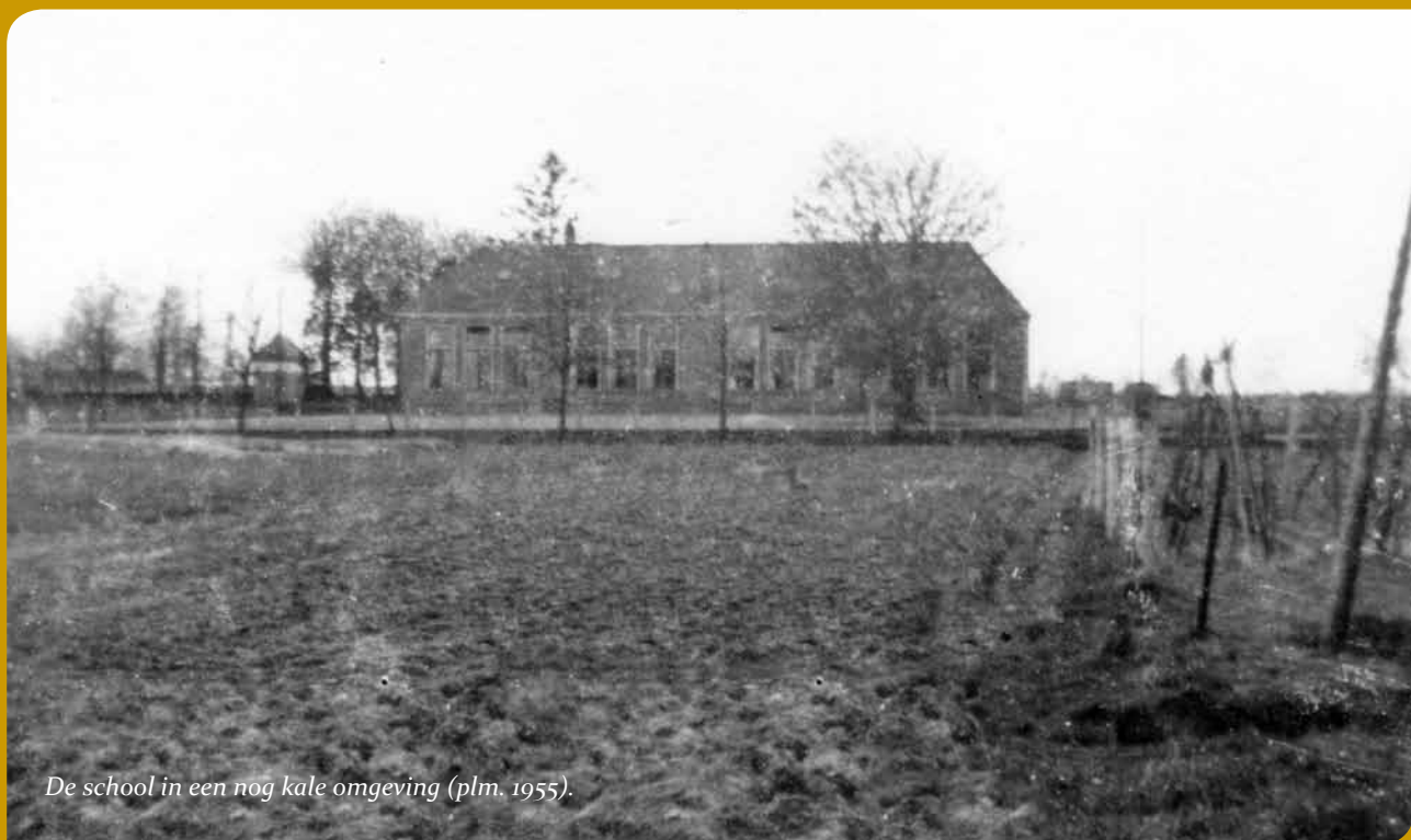
De school in een nog kale omgeving (plm. 1955).