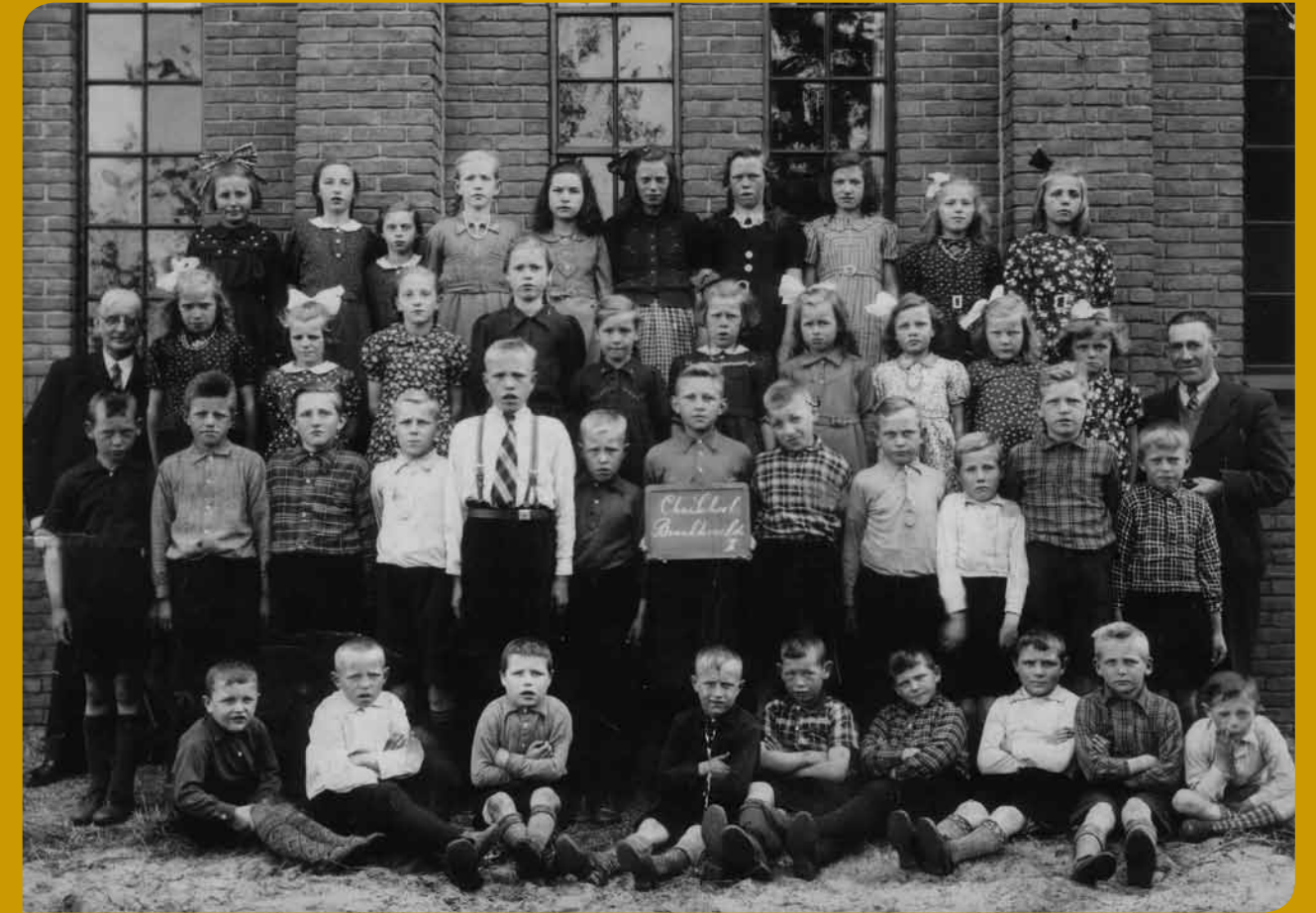
De gehele schoolbevolking in 1947